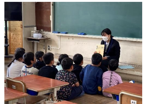
担任の先生による読み聞かせ