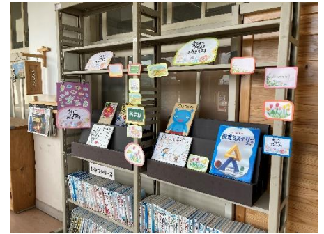
図書支援員の先生による環境整備