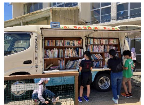
移動図書館による図書の貸出し

ご覧のとおり、現在、本山小では読書週間が実施されています。読書ビンゴの達成に向けて、いろいろな本との出会いを楽しんでほしいと願っています。